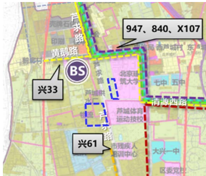
图1 现状公交线路分布示意图